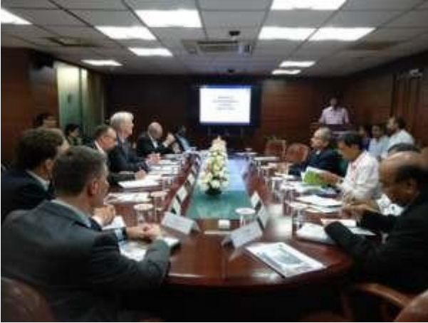
जर्मन प्रतिनिधिमंडल द्वारा एनडीएमए का दौरा

17 सितंबर, 2019 को एनडीएमए के अधिकारियों ने जर्मन से आए सात-सदस्य प्रतिनिधिमंडल से मुलाकात की। यह दौरा 16-20 सितंबर, 2019 तक, सिविल सुरक्षा एवं संरक्षण पर केंद्रित उनका भारत दौरे का एक हिस्सा था।